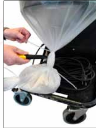
Leikkaa muovisäkki nippusiteiden välistä.