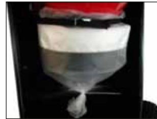
Sulje Longopac nippusiteellä kiinni.