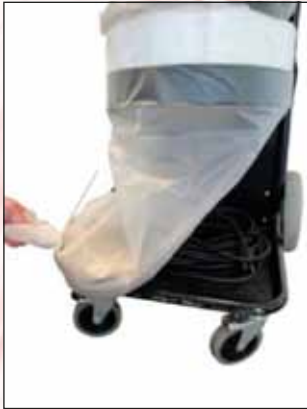
Vedä Longopacia alas.