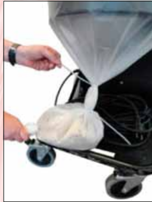
Kiristä kaksi nipusidettä vierekkäin.