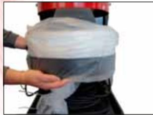
Aseta pidike säiliön alaosaan siten, että kannatinruuvit osuvat hahloon ja käännä pidike myötäpäivää kiinni.