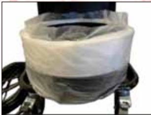
Aseta Longopac pidikkeeseen siten, että säkin sisäosa osoittaa ylöspäin ja säkin ulkoreuna alaspäin.